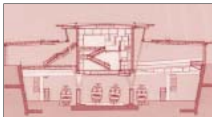
Figura 6 PROYECTO DE LA NUEVA ESTACIÓN DE VALENCE, INAUGURADA EN JUNIO DE 2001