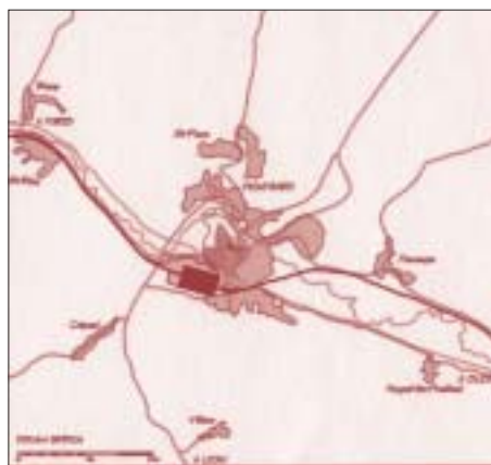
Figura 5 SITUACIÓN DE LA ESTACIÓN DE MONTBARD