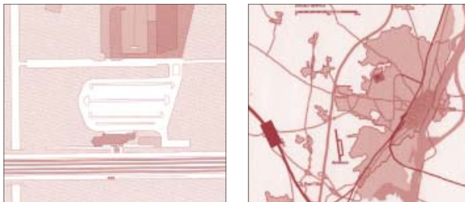
Figuras 3 y 4 MACÔN: ENTORNOS INMEDIATO Y TERRITORIAL DE LA ESTACIÓN*

* Este tipo de estaciones se caracteriza por un pequeño edificio y una superficie considerable dedicada a aparcamiento de vehículo privado.