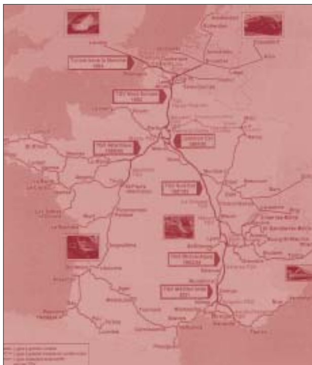
Figura 1 RED DE ALTA VELOCIDAD FRANCESA EN EL AÑO 2000