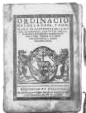
Libro de las Ordinaciones de la Cofradía y Casa de Ganaderos, 1589.

Mientras que en Castilla desarrollaba su poderosa influencia la Mesta, organización que representaba y defendía los intereses de los grandes ganaderos, en Zaragoza lo hacía la Casa de Ganaderos, con similares características y también muy importante papel en su vida económica (otras mestas o ligallos importantes, aunque menores, hubo en Tauste y Ejea, Tarazona y Albarracín, Alcañiz, Teruel, las comunidades de Aldeas de Daroca, Calatayud y Teruel, etc.).