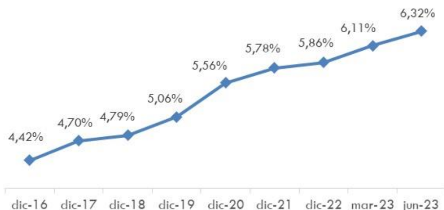
Evolución cuota de mercado fondos inversión

La labor de asesoramiento realizada por la red de oficinas de Ibercaja unido a una oferta de productos adaptada a las necesidades de los clientes han sido clave para la consecución de estos resultados de la gestora, marcando un nuevo récord de cuota de mercado.